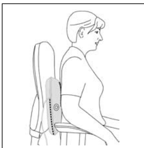
Массаж спины: нижняя часть спины (поясничный отдел позвоночника)